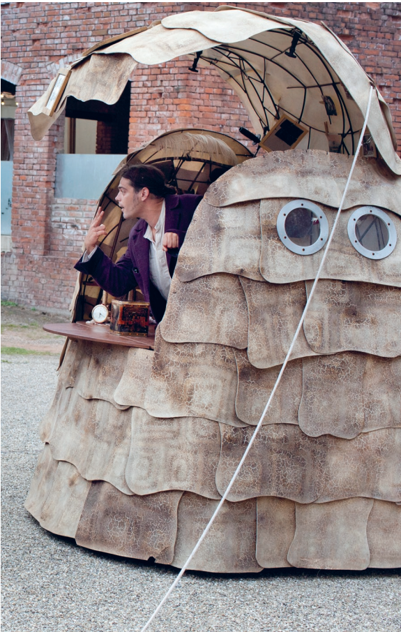
Cadhame - Halle Verrière à Meisenthal, 2011

Durée : 1h10 pour la version complète (possibilité de faire une version courte de 40 min minimum). Possibilité de jouer également sous chapiteau et en salle. AUTONOME TECHNIQUEMENT de jour comme de nuit.